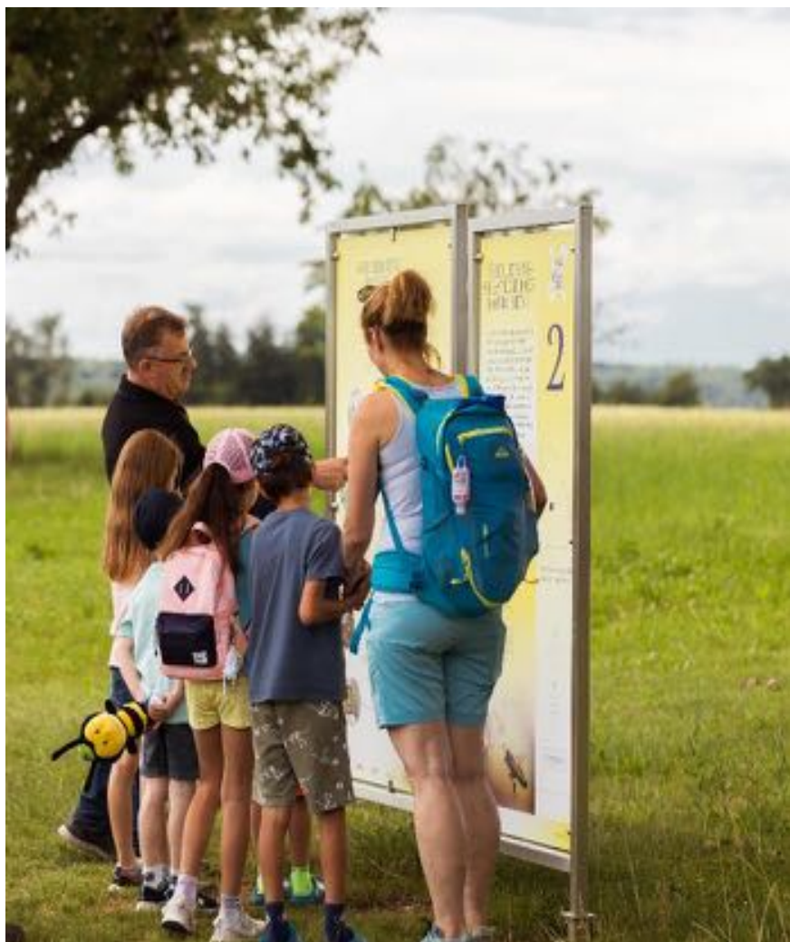
EBENRAIN – Zentrum für Landwirtschaft, Natur und Ernährung | www.ebenrain.ch