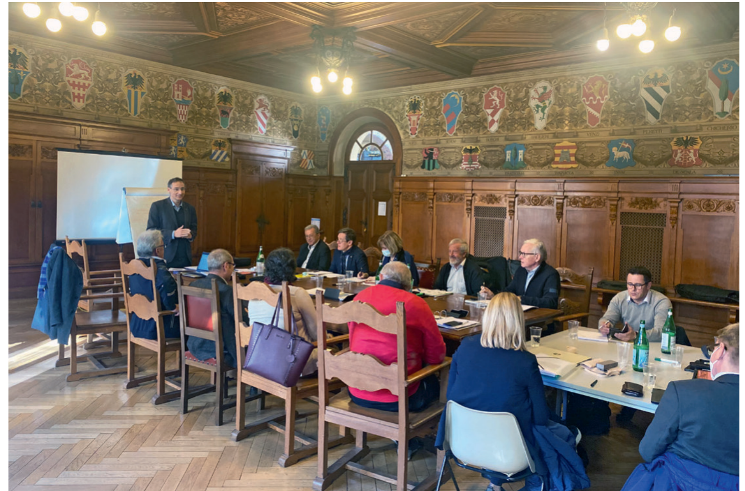
Angeregte Diskussionen im Patriziati Zimmer von Bellinzona